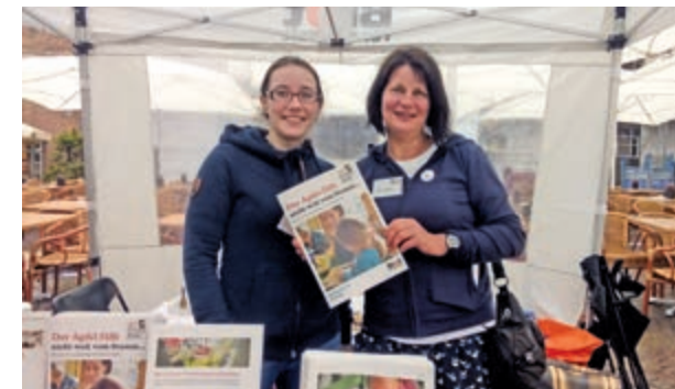
Aktionsstand Brot für die Welt